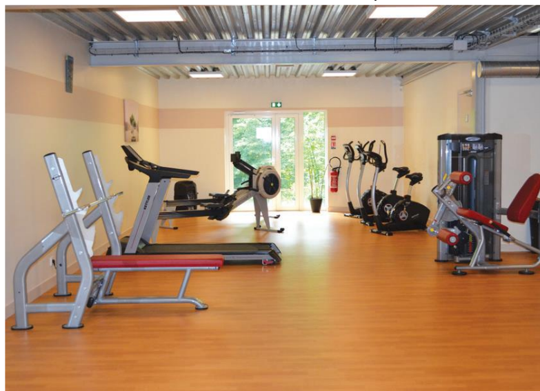
La salle de sport