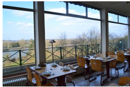
La salle à manger des patients